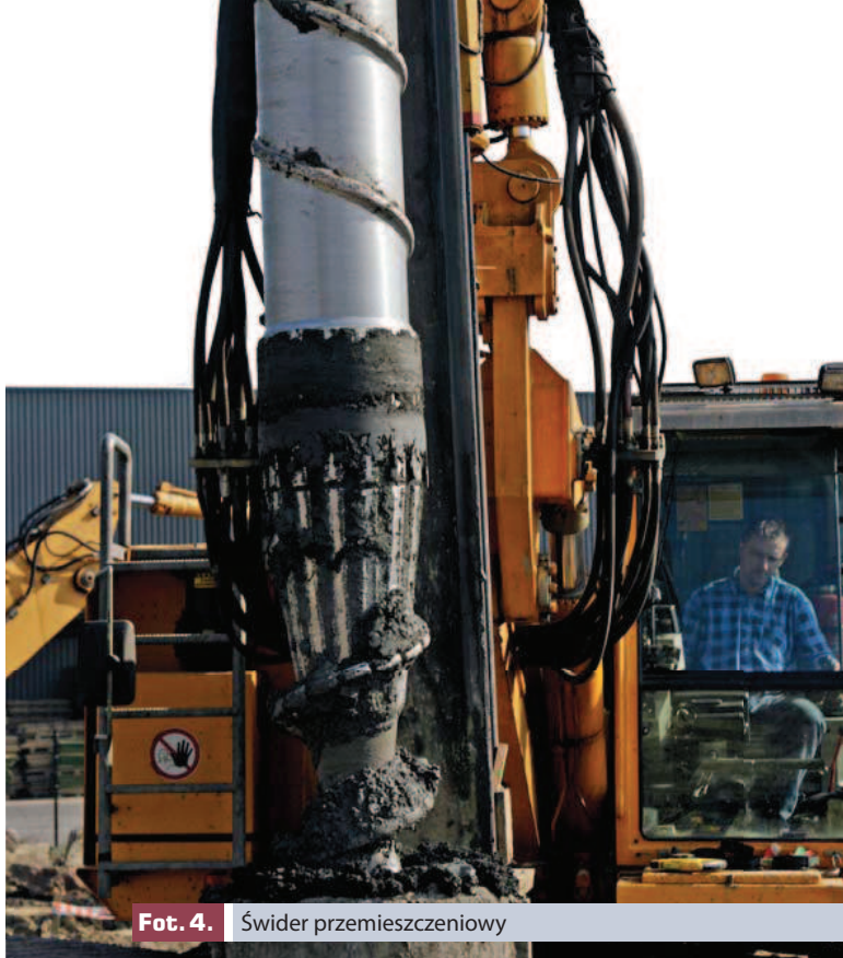
Fot. 4. Świder przemieszczeniowy