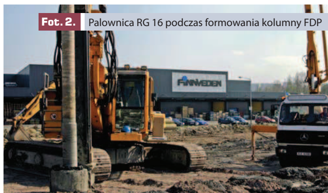
Fot. 2. Palownica RG 16 podczas formowania kolumny FDP

PPI Gerhard Chrobok sp.j., rozszerzając zakres wykonywanych usług i poszukując alternatywnych, czy też efektywniejszych technologii, podjęło w zeszłym roku decyzję o zakupie kolejnej maszyny budowlanej. Tym razem palownicy BAUER RG 16T, wyposażonej między innymi w osprzęt pozwalający na wykonywanie pali przemieszczeniowych FDP . Podstawowym elementem maszyny jest świder przemieszczeniowy (fot. 4). Świder rozpychając istniejący grunt tworzy wolną przestrzeń, w którą następnie poprzez otwór w trzonie świdra, wpompowywana jest pod ciśnieniem mieszanka betonowa. Główną zaletę tej technologii stanowi dogęszczenie gruntu na poboczniczy i pod podstawą pala uzyskane na