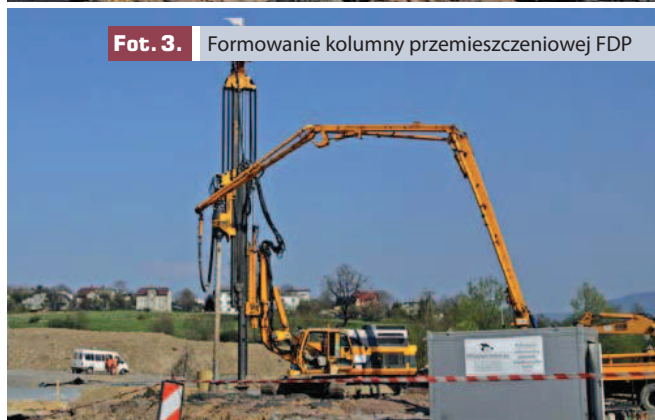
Fot. 3. Formowanie kolumny przemieszczeniowej FDP

skutek rozpychania ośrodka gruntowego, bez jego wydobywania na powierzchnię terenu. Dzięki temu również w tej metodzie nie ma potrzeby utylizacji zbędnego urobku i angażowania do tego dodatkowych maszyn i środków transportu. Pionowy nacisk na świder w trakcie wiercenia otworu w gruncie wynosi około 150 kN.